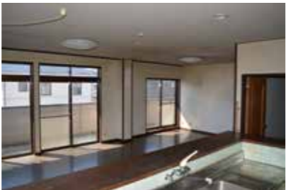
2階 住宅として利用