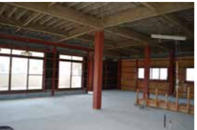
3階 趣味室や居室にリフォーム可能