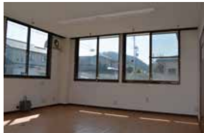
1階 店舗最適! 給湯室や事務室あり 作業場としても利用可能