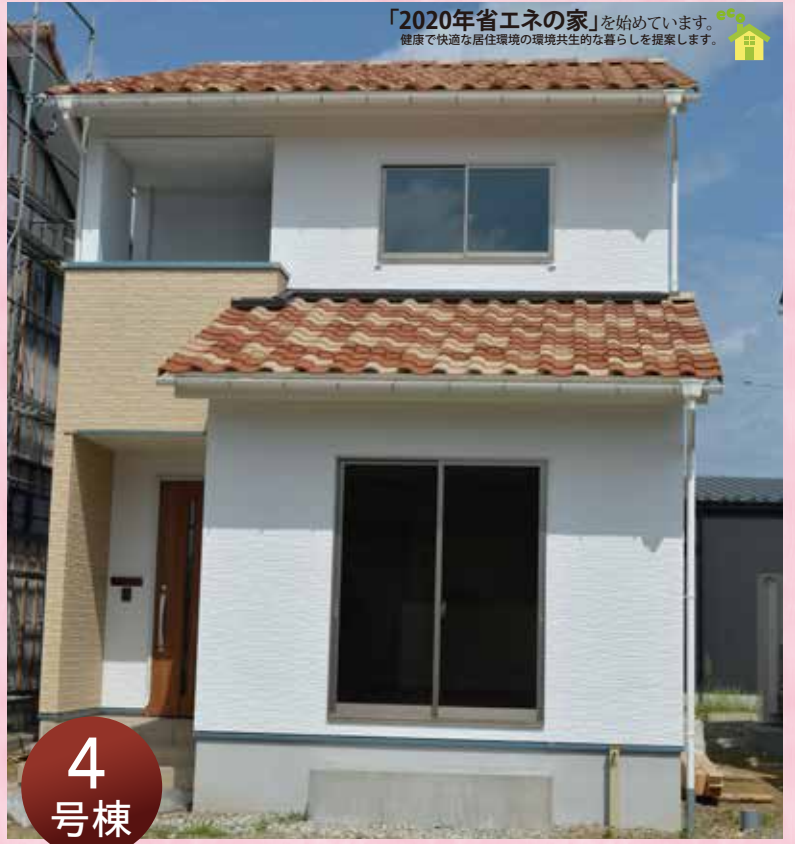
「2020年省エネの家」を始めています。健康で快適な居住環境の環境共生的な暮らしを提案します。